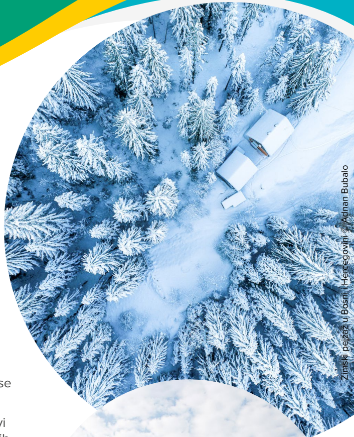
Zimski pejzaž u Bosni i Hercegovini

Na dugoročnom planu, projekat će pomoći BiH u naporima da postane članica Evropske unije. Ovaj dokument će također za relevantne organe predstavljati ključni instrument za unapređenje stanja okoliša u BiH i poboljšanje općeg zdravlja i dobrobiti sadašnjih i budućih generacija građana.