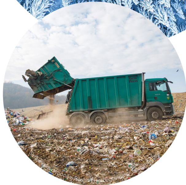
Problemi sa odlaganjem otpada u Bosni i Hercegovini

Sadržaj ESAP-a BiH će obuhvatiti sljedećih sedam politika u oblasti okoliša EU: