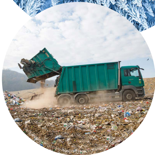
Problemi sa odlaganjem otpada u Bosni i Hercegovini

Sadržaj ESAP-a BiH će obuhvatiti sljedećih sedam politika u oblasti okoliša EU: