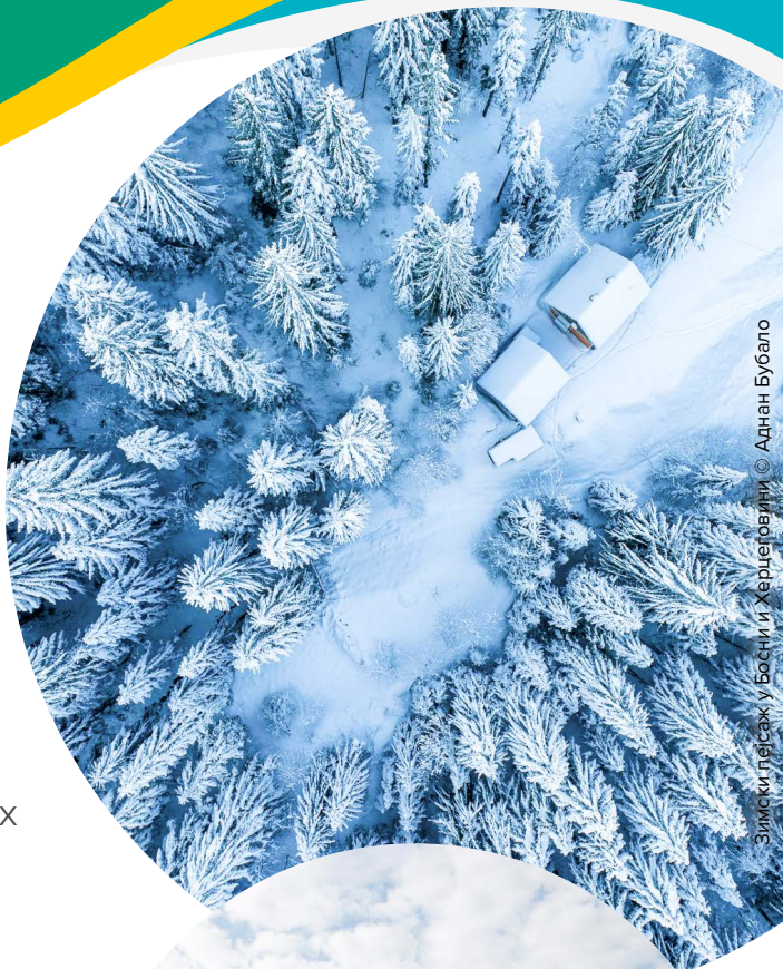
Зимски пејзаж у Босни и Херцеговини

На дугорочном плану, пројекат ће помоћи БиХ у напорима да постане чланица Европске уније. Овај документ ће такође за релевантне органе представљати кључни инструмент за унапређење стања животне средине у БиХ и побољшање општег здравља и добробити садашњих и будућих генерација грађана.