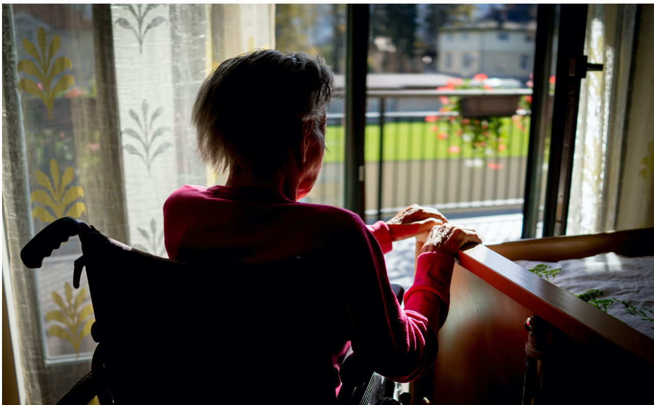
Starija žena u kolicima, u Sarajevu, BiH.

Starosna dob također može biti faktor društvene nejednakosti. Na primjer, djeca su više izložena siromaštvu 13 u odnosu na odrasle. U 2011. godini je utvrđeno da se 30,6% mladih u BiH suočava se potrošačkim siromaštvom, u odnosu na 23,4% ukupnog stanovništva. Pored toga su i dalje prisutne značajne razlike u pogledu prava djeteta, naročito kada je riječ o djeci iz romskih zajednica i drugoj djeci koja su u nepovoljnom položaju zbog rodne pripadnosti, invaliditeta, starosne dobi i mjesta stanovanja (UNICEF 2020). Podaci iz Proširene ankete o budžetu domaćinstava iz 2011. godine su pokazali da je oko tri četvrtine djece starosne dobi od 5 do 15 godina pogođeno najmanje jednom dimenzijom siromaštva 14 , a više od petine djece se suočava sa tri ili više dimenzija siromaštva. Građani/ke starije životne dobi također se mogu smatrati ugroženim zbog njihovih posebnih potreba i zavisnosti od pomoći