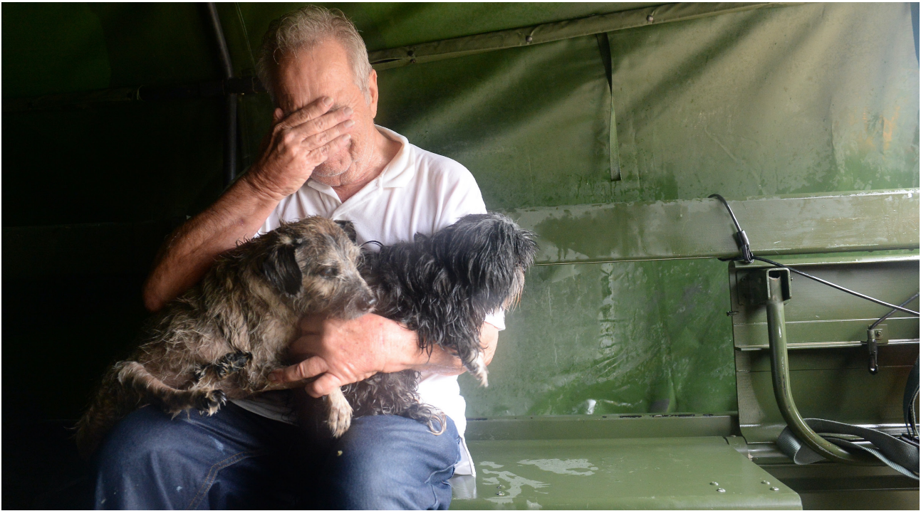
Muškarac sa psima nakon poplava.

nivo obrazovanja povezan s većom spremnošću da se izdvoji dio prihoda za rješavanje okolišnih problema i da se da prednost okolišu u odnosu na materijalna dobra (EVS, 2020). Ovo se djelimično može objasniti visokim stopama nezaposlenosti među mladima u BiH, naime u 2020. je ova stopa bila 36,6% (32,5% muškaraca, a 42,8% žena), u poređenju sa 15,9% cjelokupne radne snage (14,1% % muškaraca i 18,5% žena) (ILOSTAT, 2020). Neujednačen odnos prema okolišu ukazuje na potrebu da informativne kampanje i učešće javnosti budu bolje iznijansirani.