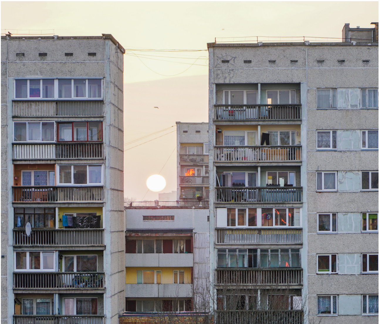
Siromašno stambeno naselje u Evropi.