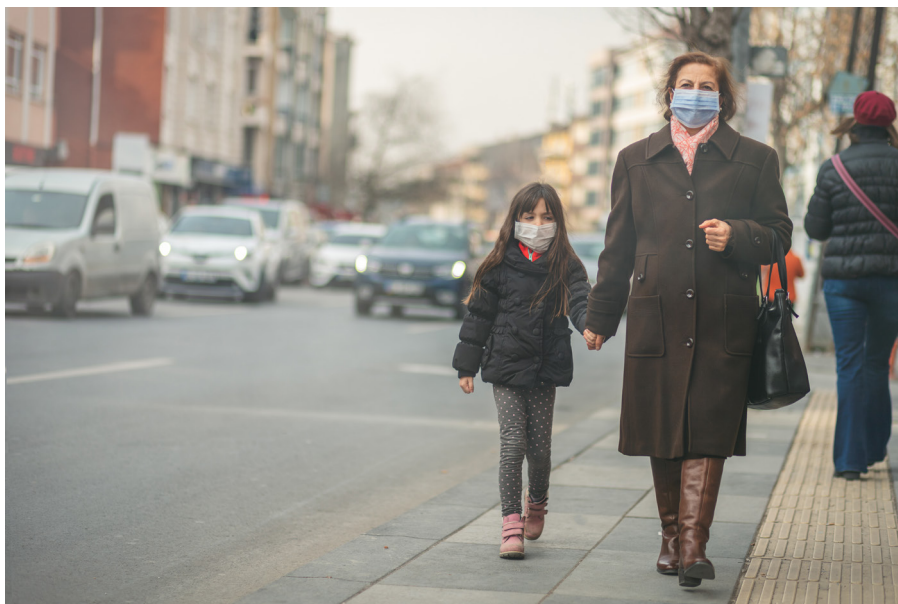
Žena i dijete nose zaštitne maske zbog zagađenosti zraka.

u BiH (Ministarstvo za ljudska prava i izbjeglice BiH, 2008) (vidi Priloge 1 i 3). Zakon o ravnopravnosti spolova u BiH, na primjer, nalaže provođenje procjene utjecaja politika i zakona u izradi na rodnu ravnopravnost (Zakon o ravnopravnosti spolova u Bosni i Hercegovini 5 , 2010). U više dokumenata politika o pitanjima GESEP-a kao što su Gender akcioni plan BiH (Agencija za ravnopravnost spolova Bosne i Hercegovine 2018) 6 , Strategija za unapređenje položaja žena u ruralnim područjima Republike Srpske (RS) 7 i Strategija BiH za rješavanje problema Roma/kinja (Ministarstvo za ljudska prava i izbjeglice BiH, 2005), naglašena je međusobna povezanost sa pitanjima okoliša. 8