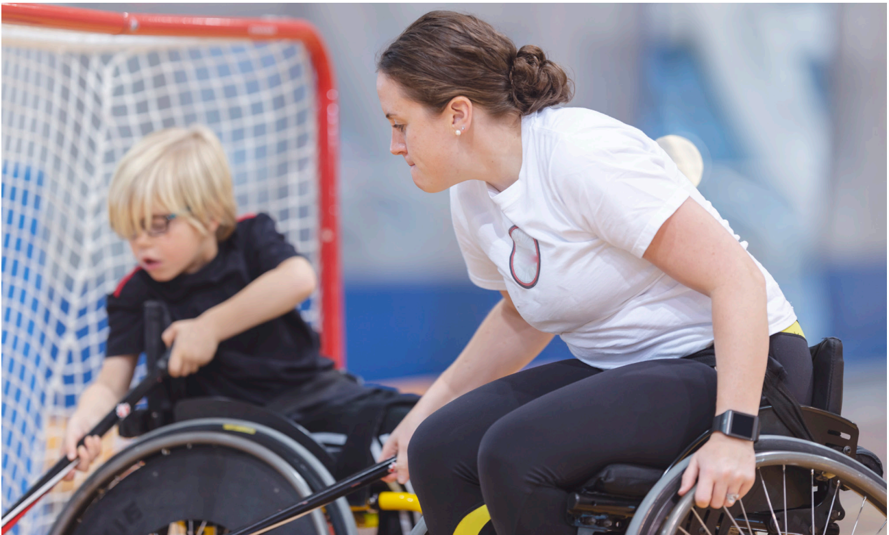
Osobe sa ograničenom pokretljivošću u sportskim aktivnostima.

Posebno su marginalizovane interseksualne i transrodne osobe, budući da transrodne osobe „često prijavljuju diskriminaciju, incidente ili zločine iz mržnje zasnovane na rodnom identitetu, govor mržnje i verbalne napade, vršnjačko ili nasilje u porodici“ dok su interseksualne osobe još uvijek nevidljive u smislu zakonskih rješenja (Pandurević i dr., 2018, str. 48). Zakon o ravnopravnosti spolova ne sadrži nijedan član koji se tiče interseksualnih ili transrodnih osoba. Zakonom o zabrani diskriminacije, koji je usvojen 2009. godine, zabranjuje se diskriminacija transrodnih osoba, a u nekoliko izmjena i dopuna iz 2016. godine je naložena zabrana diskriminacija zasnovane na spolnim karakteristikama, što je ključni korak u zaštiti ljudskih prava transrodnih osoba. Međutim, u praksi prava transrodnih i interseksualnih osoba u BiH još uvijek nisu dovoljno zaštićena (Pandurević i dr., 2020). Tako je na primjer pravo na samoopredjeljenje (u ovom slučaju u pogledu određivanja roda ili rodnog identiteta) ograničeno ili onemogućeno postojećim zakonskim rješenjima i praksama (Isić, 2018).