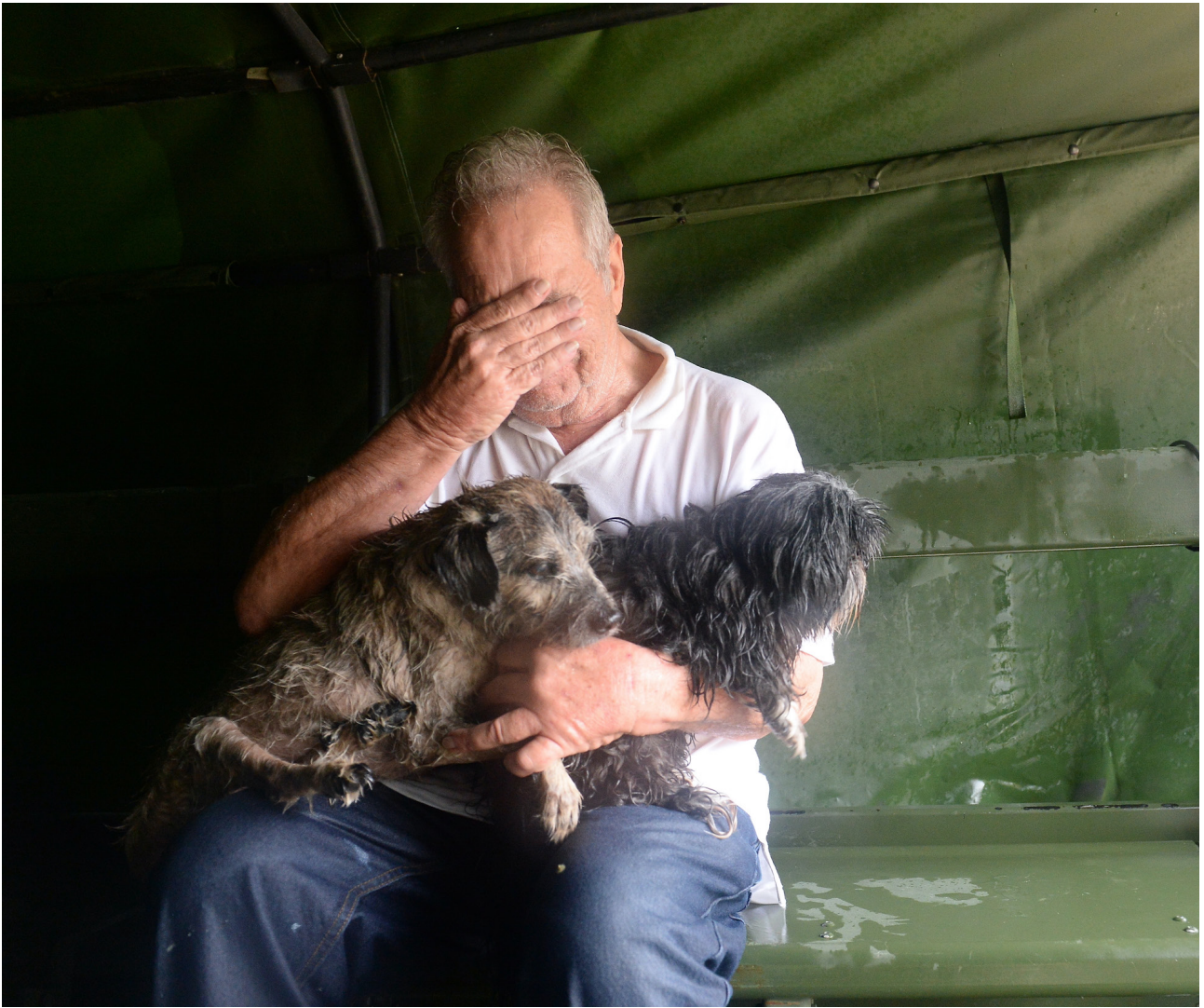
Имаге Мушкарац са псима након поплава.

раднике, домаћинства и заједнице чија егзистенција зависи од ових дјелатности (Свјетска банка, 2018).